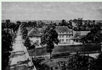
Widok na Szkołę Zawodową Żeńską z wieży kościelnej (1939)

ziemia przynosiła bardzo niskie plony, a bieda zaglądała do większości domostw w ciągu 20-30 lat udało się ks. Blizińskiemu przekształcić w sprawnie działającą wspólnotę lokalną. Ks. Bliziński zdołał pokonać nie tylko początkową wzajemną niechęć ludzi do współpracy oraz podejrzliwość mieszkańców Liskowa, ale także zaszczerpić w nich idee spółdzielczości,