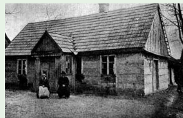
Pawilon główny Sierocińca św. Wacława w Liskowie (ok. 1925 r.)

Spółdzielnia Rolniczo-Handlowa „Gospodarz”, która świadczyła pomoc we wprowadzaniu innowacji w produkcji rolnej. Członkowie spółdzielni otrzymywali nasiona, nawozy sztuczne, pieniądze oraz możliwość zaopatrywania się w tanie i dobrej jakości towary. Wioskę, w której analfabetyzm dotykał 90 proc. mieszkańców, szerzyło się pijaństwo i kradzieże,