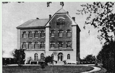
Szkola Społeczno-Rolnicza (1937)

mieszkańców wsi w małe lokalne inicjatywy, z których z biegiem lat powstały przedsiębiorstwa, organizacje społeczne i ośrodki edukacyjne. Liskowianie nauczyli się, że współpraca może zaowocować korzyściami nie tylko dla pojedynczych ludzi, ale i dla całej społeczności.