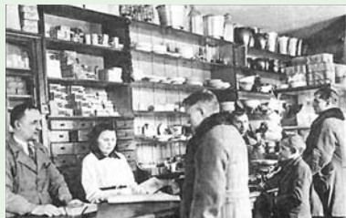
Wnętrze Spółdzielni Rolniczo-Handlowej w Liskowie (lata 30-te)

symbolem sukcesu i wzorem do naśladowania dla innych ośrodków w całym kraju. Charyzmatyczny lider potrafił przekonać do współpracy i zaangażować