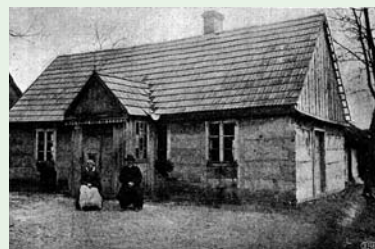
Przytułek dla starców (ok. 1905)

W ciągu dwóch-trzech dekad Lisków przeobraził się w prężny gospodarczo ośrodek wiejski, z rozbudowanym systemem placówek oświatowych, rozwiniętą opieką zdrowotną, własnym czasopiśmie i instytucjami kulturalnymi. Z biegiem lat powstały też: spółdzielnia spożywcza, chór i orkiestra, teatrzyk amatorski, kasa